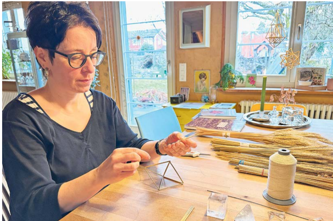
Auffädeln und verknoten ist erst der zweite Schritt, zuerst werden alle Halme abgelängt. Ein «Himmeli» sollte sich leicht bewegen und Schatten werfen können.

«Jede Familie hatte ihre Spezialitäten und hütete die Anleitungen und nötigen Hilfsmittel dafür wie einen Schatz», erzählt Barbara Egli. Für diese Art von Heimararbeit brauchte es fast keine Maschinen, aber umso mehr Know-how. Das wurde von Generation zu Generation weitergegeben, oder es ging verloren. «So manche haben ihre Schablonen, Kämmen, Tricks und Techniken lieber mit ins Grab genommen, als das Geheimnis der Konkurrenz zu überlassen.» Ähnlich verhielt es sich bei den Posamenten, den verschnörkelten Verzierungen an Kleidern und Uniformen, die jahrhundertlang sehr gefragt wa-